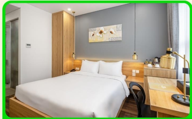
พักเมืองดานัง 4 ดาว 3 คืน