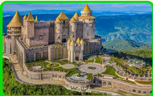
เที่ยวบานาฮิลล์แบบจุใจ เต็มวัน