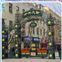
ถนนจงยาง