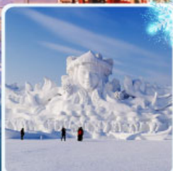
งานแกะสลัก เกาะพระอาทิตย์