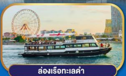
ล่องเรือทะเลดำ