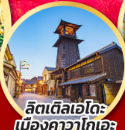
ลิตเติลเอโดะ เมืองคาวาโกเอะ