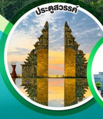
ประตูลสุวรรณค์