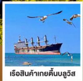
เรือสินค้าเกย์ตันบลูอิส