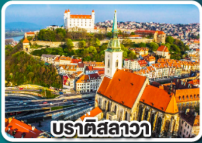
ปราทิสลาวา