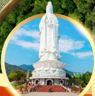
วัดหลิงอึ้ง