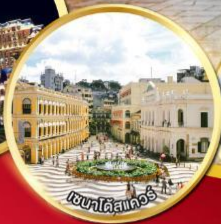
เซนต์มาร์ค