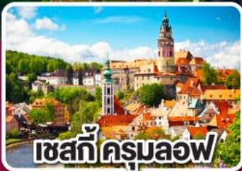
เชสกีครุมลอฟ

ฮังการี สโลวาเกีย ออสเตรีย เชก 7 วัน 4 คืน