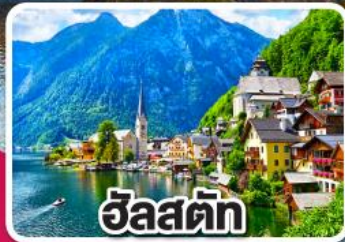
ฮัลสตัดท์