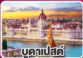
บูดาเปสต์