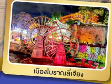
เมืองโบราณลี่เจียง