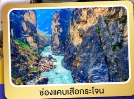
ช่องแคบเสื่อกระโจน

เมนูพิเศษ ! สุกี้ปลาแซลมอน สุกี้เห็ด อาหารกวางตุ้ง