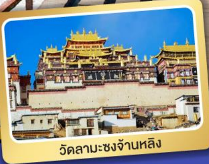
วัดลามะชงจ้านหลิง