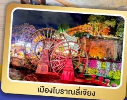
เมืองโบราณลี่เจียง