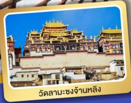
วัดลามะชงจ้านหลิง