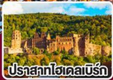
ปราสาทไฮเดลเบิร์ก