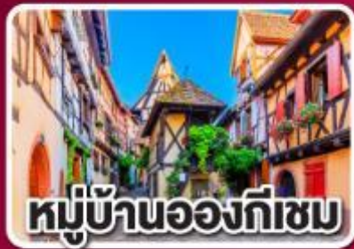
หมู่บ้านองก์เซม