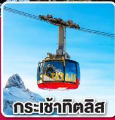
กระเช้าทิตลิส

"ทิตเซ" เมืองแห่งนาฬิกาทุกคู่ และ ต้นกำเนิดเค้กเบสิกฟออสต์