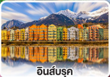
อินส์บรุค