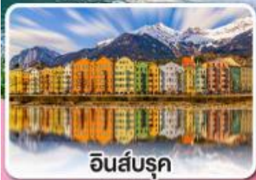
อินส์บรุค