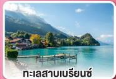
ทะเลสาบเบรียนซ์