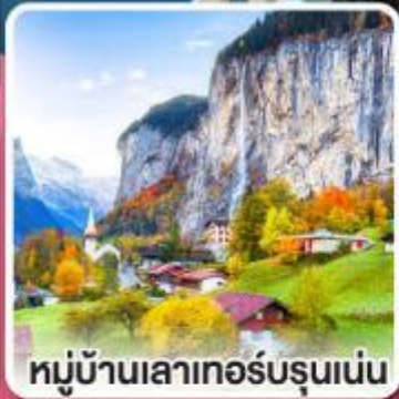
หมู่บ้านเลาเทอร์บรุนเนน