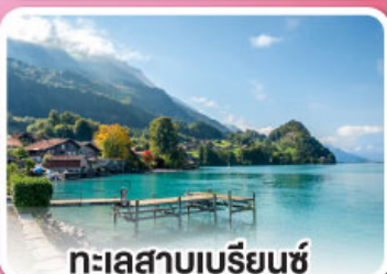
ทะเลสาบเบรียนซ์