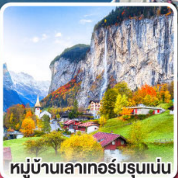
หมู่บ้านเลาเทอร์บรุนเนน