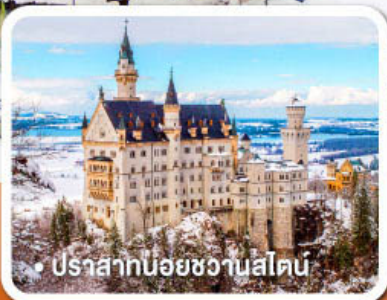
ปราสาทน้อยหวานสไตน์