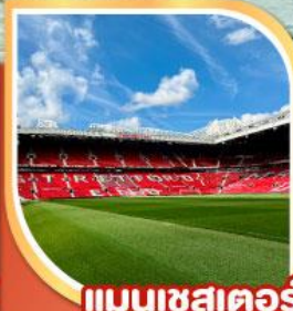
แมนเชสเตอร์

19-26 ธ.ค.67 | 26 ธ.ค.-02 ม.ค.68 23-30 ม.ค.68 | 20-27 ก.พ.68 06-13 มี.ค.68 | 20-27 มี.ค.68