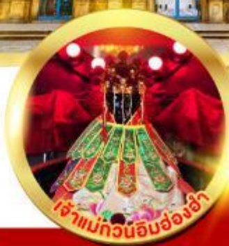
เจ้าแม่กวนอิมอ่องอ่า