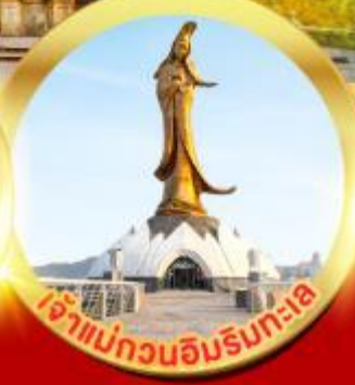
เจ้าแม่กวนอิมรับทะเล