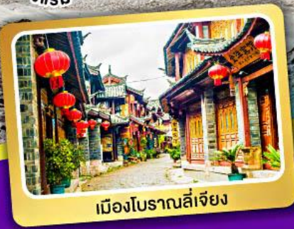
เมืองโบราณลี่เจียง