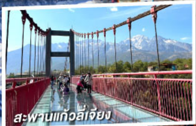
สะพานแก้วลี่เจียง