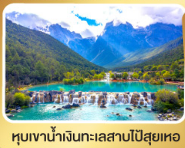
หุบเขาน้ำเงินทะเลสาบไป๋สือเหอ