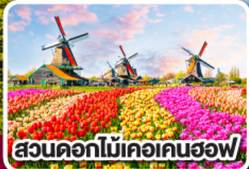
สวนดอกไม้เคอเคนฮอฟ

ดอกไม้ที่สดใส กับ หัวใจที่เบิกบาน ฝรั่งเศส เบลเยียม ลักเซมเบิร์ก เยอรมนี เนเธอร์แลนด์ 8 วัน 6 คืน