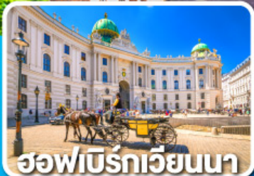
ฮอฟบวร์กเวียนนา