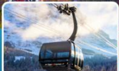
กระเช้า ไอเกอร์เอ็กสเพรส สู่จุงเฟรา