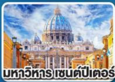
มหาวิหารเซนต์ปีเตอร์