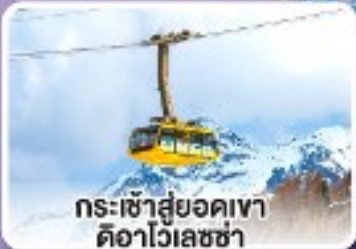
กระเช้าสู่ยอดเขาดืออาไวเลซซา