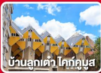
บ้านลูกเต๋า โคทคูบัส