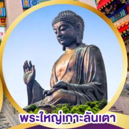
พระใหญ่เกาะลันเตา