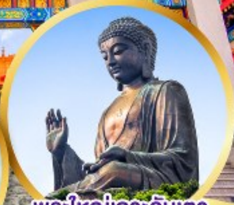
พระใหญ่เกาะลันเตา