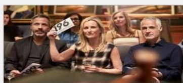
Art Gallery & Auctions