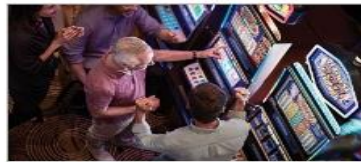
Vegas Style Casino