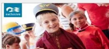
Discovery at SEA Programs