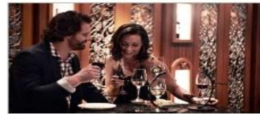
Vines Wine Bar