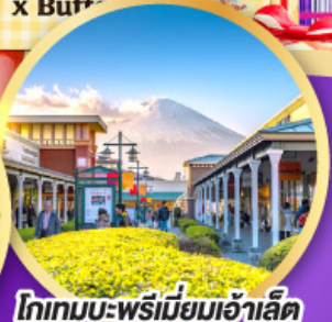
โกทาบะ-พรีมียมเอ้าลิต