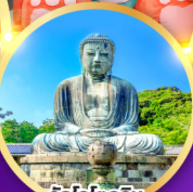
วัดโคโคคุอิน