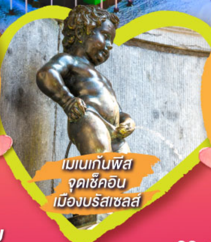
เมเนกันพิส จุดเช็คอิน เมืองบรัสเซลส์