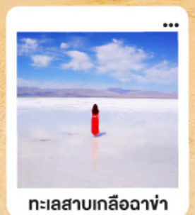
ทะเลสาบเกลือฉางซ่า