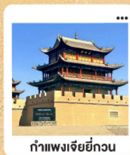
ถ้ำเพงเจียยี่กวน