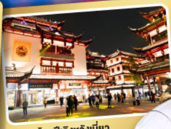
ตลาดร้อยปีเฉิงหวงเหมียว