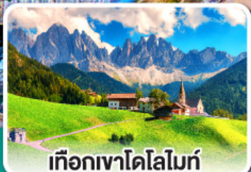
เทือกเขาโดโลไมท์