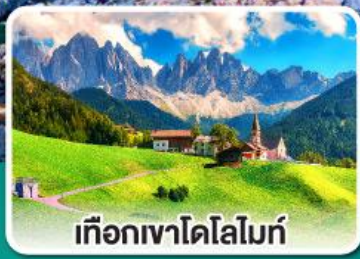
เทือกเขาโดโลไมท์