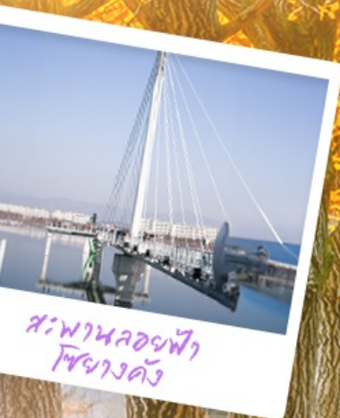
สะพานลอยฟ้า โซฮางดง