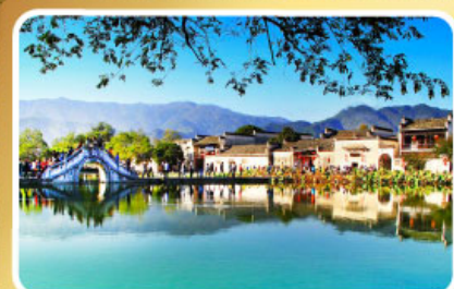
หมู่บ้านผดงโลก หงซุน