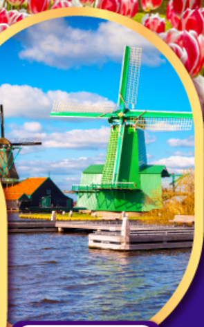
หมู่บ้านกังหันลม ซาซคันส์

08-16 ก.พ.68 09-17, 10-18 เม.ย.68 23 เม.ย.-01 พ.ค.68