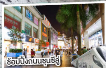
ช้อปปิ้งถนนชุนชี่