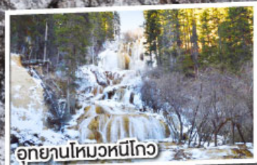
อุทยานโหมวหนี่โกว