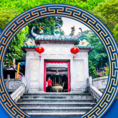
วัดเจ้าแม่กวนอิมสองห้า