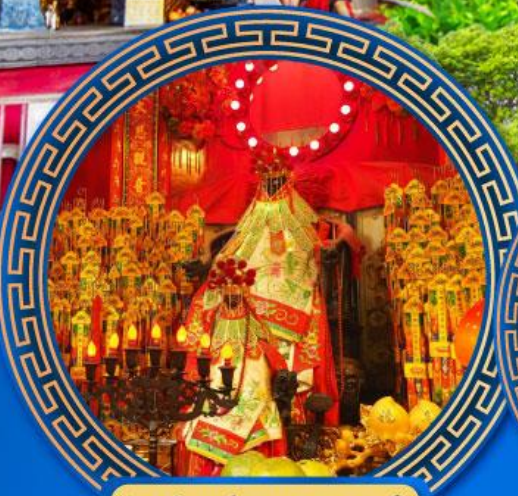
วัดเจ้าแม่กวนอิมสองห้า