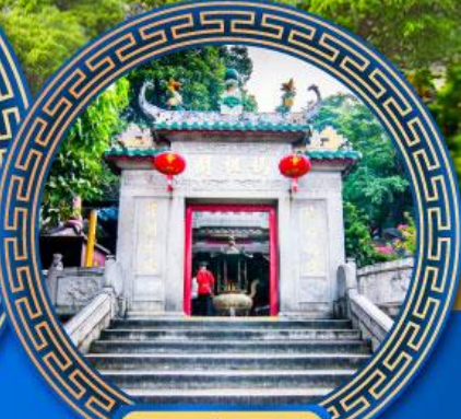
วัดอาม่า มาเก๊า