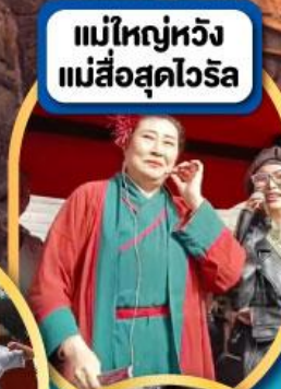
แม่ใหญ่หวัง แม่สื่อสุดไวรัล