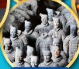
กองทัพ ทหารดินเผา จีนซี