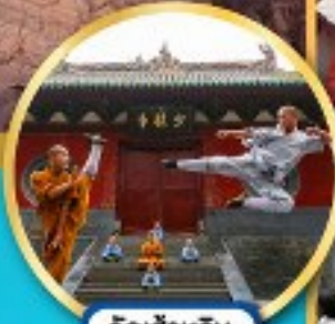
วัดเส้าหลิน ตำนานกั๋งฟู