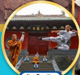
วัดเส้าหลิน ตำนานกังฟู