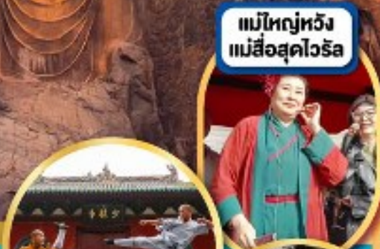
แม่ใหญ่หวัง แม่สื่อสุดไวรัล