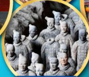
กองทัพ ทหารดินเผา จีนซี