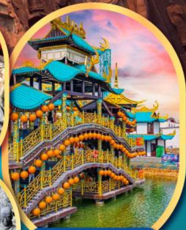
เหวว่านชู่ซาน นครจอมยุทธ