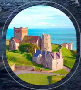
United Kingdom Dover