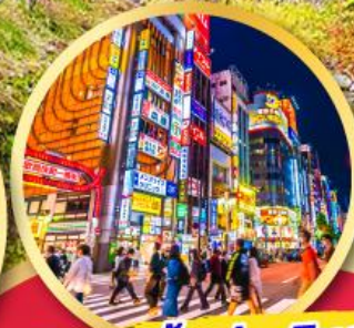
ช้อปปิ้ง ย่านชินจูกุ