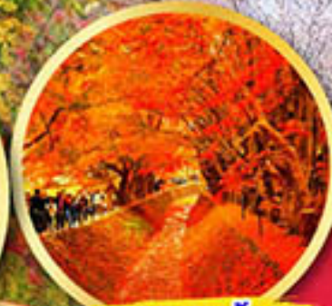
อุโมงค์ใบเมเปิ้ล โมมิจิ ไคโร