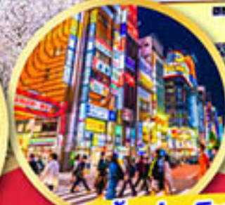
ช้อปปิ้ง ย่านชินจูกุ

พักออนเซ็น 1 คืน , พักโตเกียว 2 คืน บินเข้านาโกย่า-ออกโตเกียว