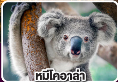
หมีโคอาล่า