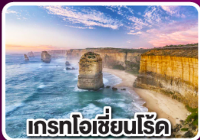
เกรทโอเซียนโรด