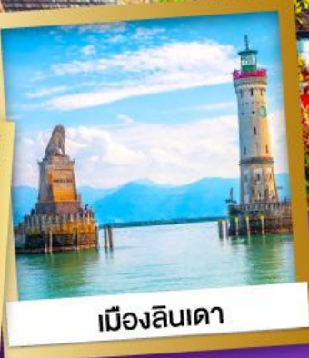
เมืองลินเดา