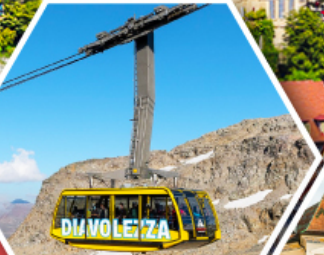
กระเช้าดีอาโวลูเซซ่า