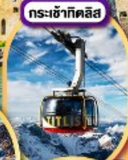
กระเช้ากิตลิส