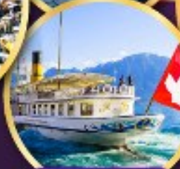
ส่องเรือ ทะเลสาบเจนีวา