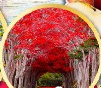
อุโมงค์เมเปิ้ลแดง ณ สวนลับฮิราโอคะ