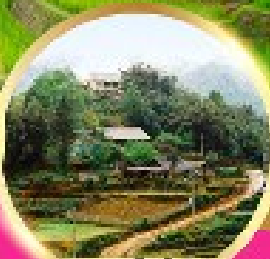
หมู่บ้านก๊อตก๊ต