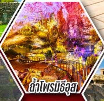
ด้าไฟรมีริอุส