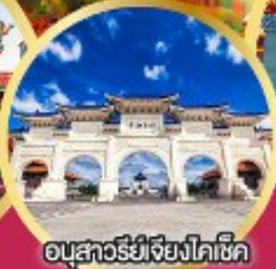
อนุสาวรีย์เจียงไคเช็ค