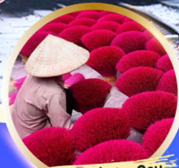
หมู่บ้านรูป Phu Cau