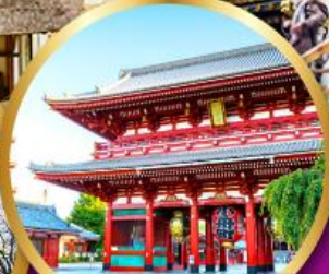
วัดอาซากุสะ