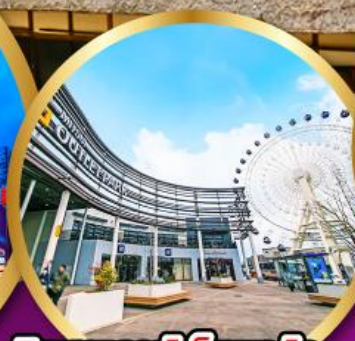
มิตซูเอากะไลท์พาร์ค เซนได