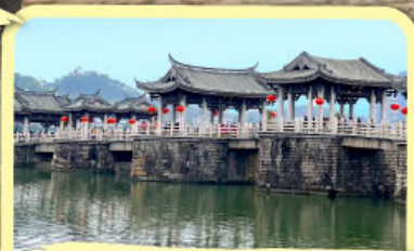
• สะพานโบราณกว้างจี้